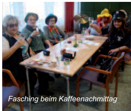
Fasching beim Kaffeenachmittag