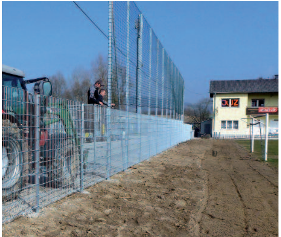
Montagearbeiten beim Ballfangnetz

Es ist dies eine dringliche Maßnahme gewesen, um das Sportplatzareal wieder ansehnlicher und zeitgemäßer zu gestalten.