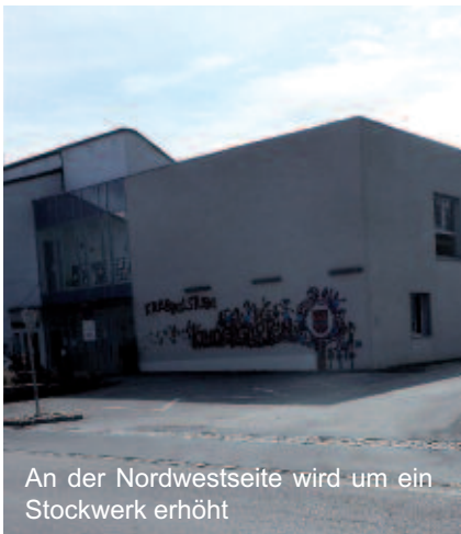
An der Nordwestseite wird um ein Stockwerk erhöht

Nach der gelungenen Startveranstaltung „ Zukunftsentwicklung Luftenberg “ fand am 20. Jänner 2017 ein Workshop zu den vier Themenschwerpunkten Ortsentwicklung, Verkehr, Soziales und Bürgernähe statt. In diesen Arbeitsgruppen werden erste Planungsschritte erarbeitet und in weiterer Folge wird es die Möglichkeit einer Bürgerbeteiligung geben.