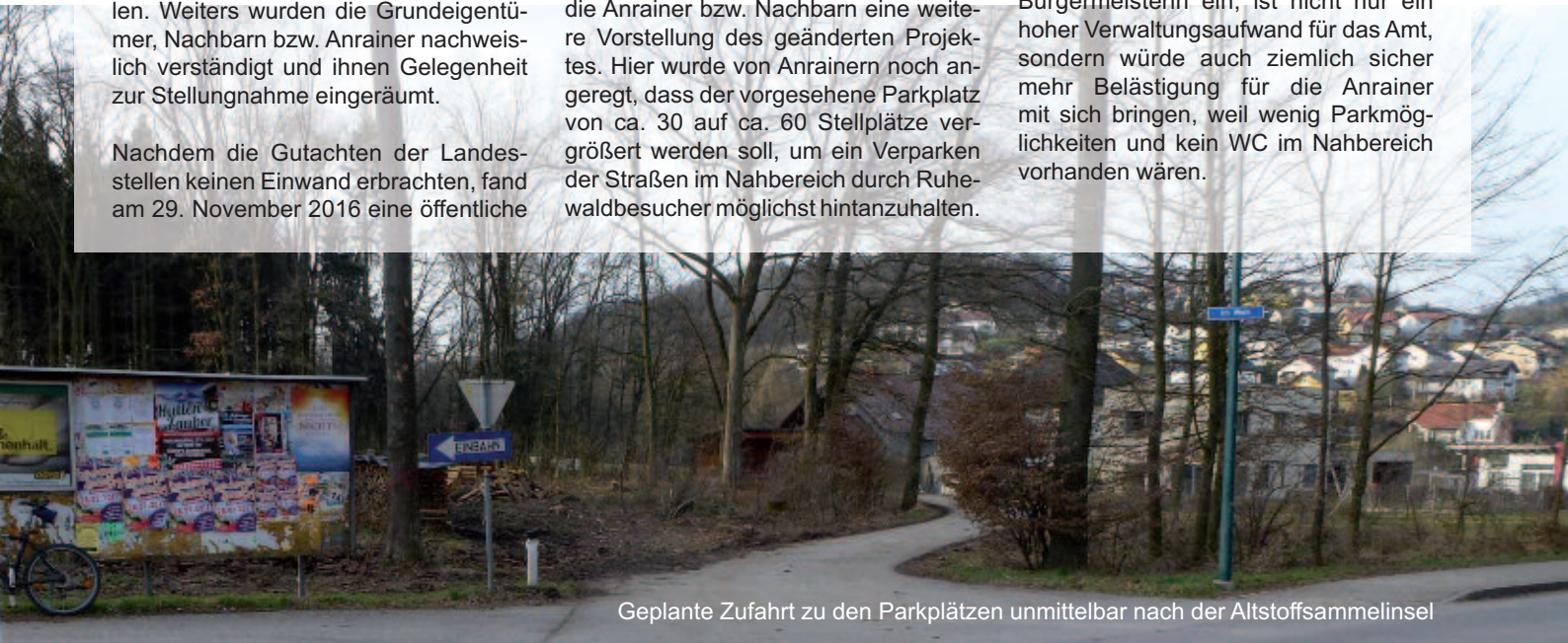
Geplante Zufahrt zu den Parkplätzen unmittelbar nach der Altstoffsammelinsel

Es ist mir bewusst, dass nicht alle Bedenken zu diesem Projekt ausgeräumt werden konnten. Aufgrund der Rechtslage im OÖ Leichenbestattungsgesetz ist es mir aber wichtig, dass ich als Gemeindevertreter bei einem solchen Projekt mitentscheiden und Verbesserungen herbeiführen kann. Die Alternative, das Projekt abzulehnen und der Betreiber reicht dann für jede einzelne Urnenbestattung einen Antrag bei der Bürgermeisterin ein, ist nicht nur ein hoher Verwaltungsaufwand für das Amt, sondern würde auch ziemlich sicher mehr Belästigung für die Anrainer mit sich bringen, weil wenig Parkmöglichkeiten und kein WC im Nahbereich vorhanden wären.