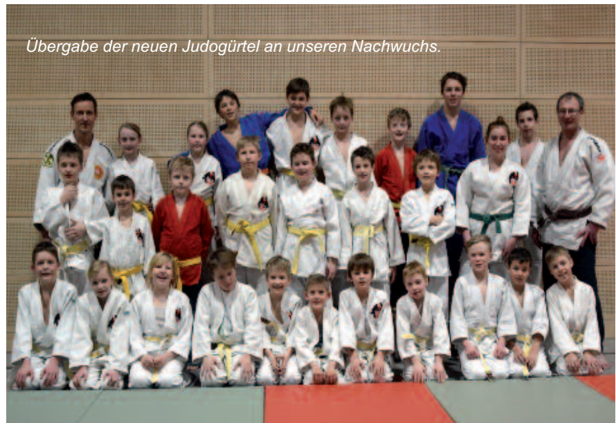
Übergabe der neuen Judogürtel an unseren Nachwuchs.