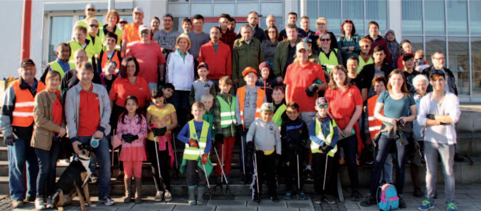
Die Teilnehmer an der Flursäuberung

Ein herzliches Danke an alle freiwilligen HelferInnen, die Mitglieder der Feuerwehr und an die MitarbeiterInnen des Innen- und Außendienstes der Gemeinde für die Durchführung der Flursäuberung 2017