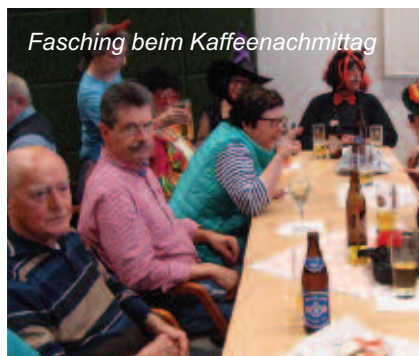
Fasching beim Kaffeenachmittag