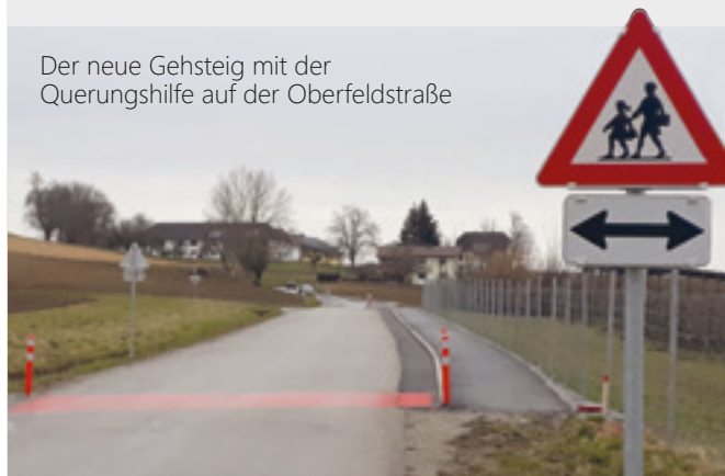
Der neue Gehsteig mit der Querungshilfe auf der Oberfeldstraße

In den letzten Monaten konnte auf der Oberfeldstraße von Statzing bis zur Orts-einfahrt Abwinden der Gehsteig verlängert werden. Für die Errichtung des oberen Teiles wurde Held & Francke beauftragt. Der restliche Teil, die „nur“ geschotterte Strecke, wurde durch unsere Bauhofmitarbeiter realisiert. Ein asphaltierter Gehsteig konnte dort nicht errichtet werden, da der Erwerb des angrenzenden Grundstreifens nicht möglich war. Die Gesamtkosten für die Gemeinde belaufen sich auf etwa € 138.000,00.