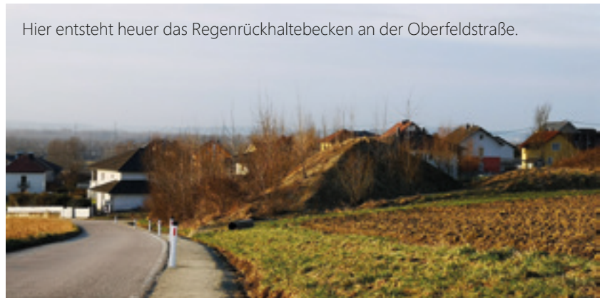
Hier entsteht heuer das Regenrückhaltebecken an der Oberfeldstraße.

Auch die Fertigstellung des Regenrückhaltebeckens Oberfeldstraße steht heuer an. Das dafür benötigte Erdmaterial ist bereits am vorgesehenen Standort gelagert. Die vorgesehenen Mittel für die Fertigstellung betragen € 70.000,00.