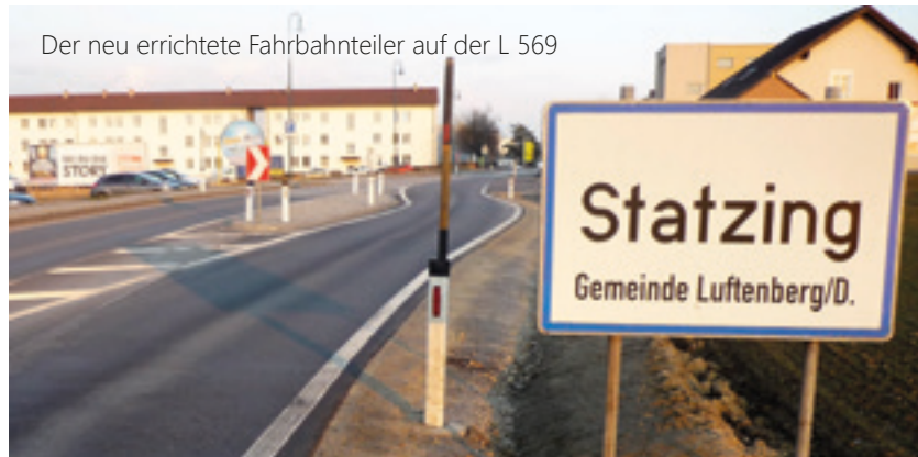
Der neu errichtete Fahrbahnteiler auf der L 569

Die Errichtung des Fahrbahnteilers musste vor der Verordnung des Zebrastreifens erfolgen. Denn die BH kann einen Zebrastreifen nur in einem nachgeordneten Verfahren an die Bauarbeiten verordnen. Die Kosten werden zwischen dem Land OÖ und der Gemeinde aufgeteilt. Die Endabrechnung ist derzeit noch nicht erfolgt.