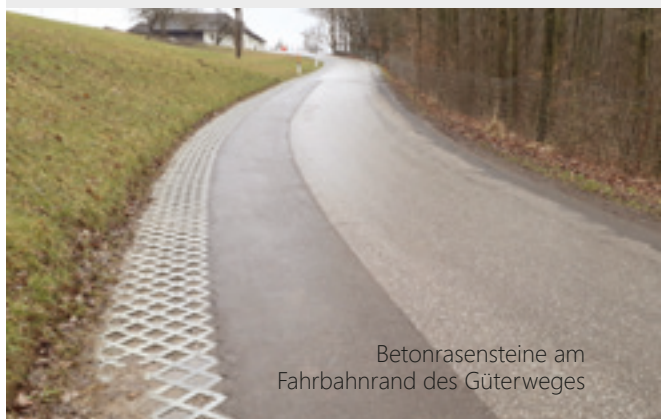
Betonrasensteine am Fahrbahnrand des Güterweges

Auf dem Güterweg Gröbetsweg konnten auf einer Länge von etwa 150 m, zur besseren Befahrbarkeit, Betonrasensteine verlegt werden. Danke an die Anrainerfamilien für ihr Entgegenkommen. Die Kosten für die Gemeinde belaufen sich auf etwa € 7.500,00.