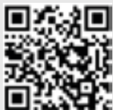
TTC Luftenberg auf Facebook