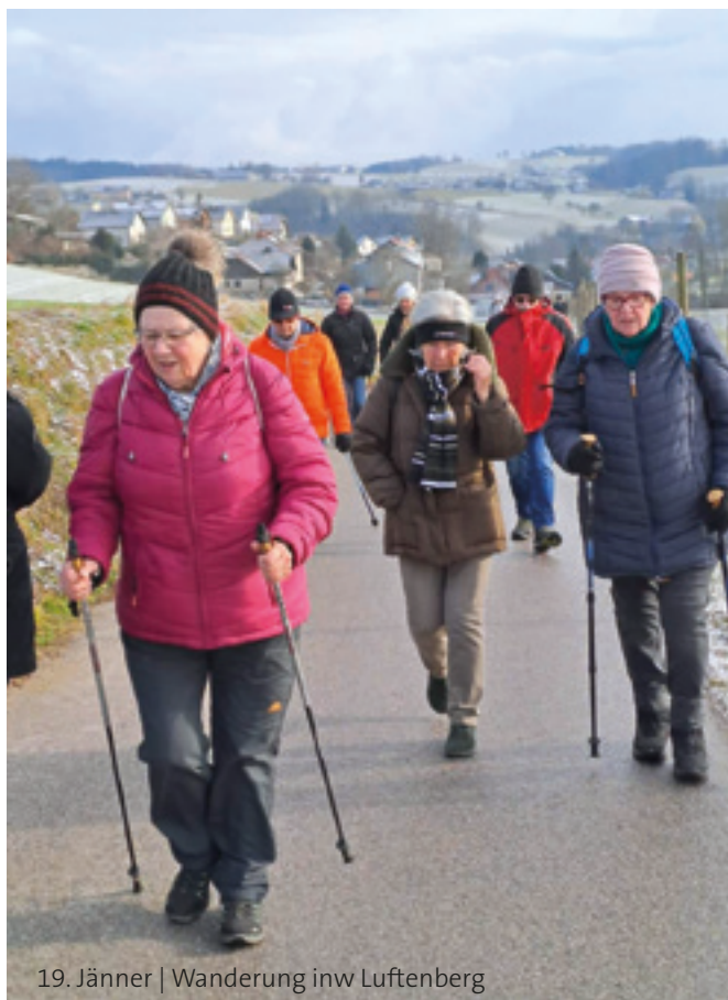
19. Jänner | Wanderung inw Luftenberg

09. Februar | Wanderung Donaubrücke Fischaufstieg und rund um den Ausee, Einkehr Pacino.