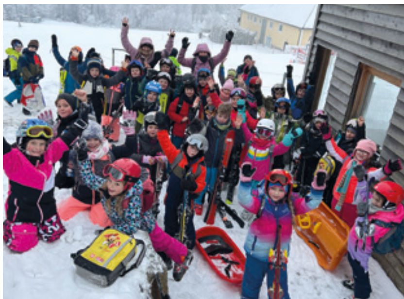
Wie auf den Fotos zu erkennen ist, hatten wir alle großen Spaß!

Aber auch für nicht ganz so begeisterte Schifahrer:innen wurde ein Programm geboten. Den abseits der Piste konnten die Kinder mit ihren Schlitten und Bobs den Berg hinuntersausen.