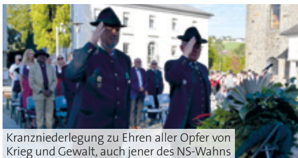
Kranzniederlegung zu Ehren aller Opfer von Krieg und Gewalt, auch jener des NS-Wahns