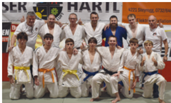
Die Luftenberger Mannschaft nach dem Sieg gegen Ort/Innkreis