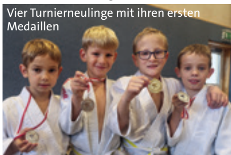
Vier Turnierneulinge mit ihren ersten Medaillen

Parallel dazu fanden in Leonding die ASKÖ-Bundesmeisterschaften mit 276 Teilnehmer:innen aus 30 Vereinen, darunter 8 Athlet:innen aus Luftenberg, statt.