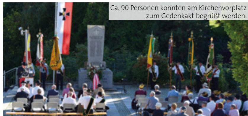
Ca. 90 Personen konnten am Kirchenvorplatz zum Gedenkakt begrüßt werden.