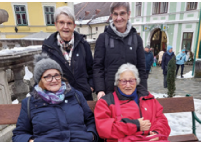
29.11. | Ausflug zum Weihnachtsmarkt nach Weitra NÖ