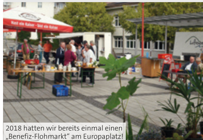
2018 hatten wir bereits einmal einen „Benefiz-Flohmarkt“ am Europaplatz!

Wir laden die Bevölkerung herzlich ein, uns am 30. Mai von 6:00 bis ca. 14:30 Uhr am Europaplatz in Luftenberg zu besuchen. Es gibt Antiquitäten, Ziergegenstände, Haushaltsartikel, selbstgezogene Mittelmeerpflanzen u.v.a.m.